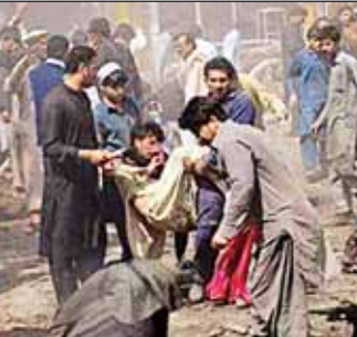
आत्मघाती हमला था जिसका निशाना उपाध्यक्ष थे।

पाकिस्तान के अशांत दक्षिण पश्चिमी बलूचिस्तान प्रांत में शुक्रवार (12 मई) को एक शक्तिशाली विस्फोट में 25 व्यक्ति मारे गए और 35 अन्य घायल हो गए। इस जानलेवा हमले में पाकिस्तान की सीनेट के उपाध्यक्ष बाल बाल बच गए, हालांकि उनकी कार क्षतिग्रस्त हो गई और वह घायल हो गए। प्रांत के मस्तुंग इलाके में मौलाना अब्दुल गफूर हैदरी को निशाना बनाया गया, जब वह एक मस्जिद में जुमे की नमाज के बाद वहां मौजूद लोगों को संबोधित करके बाहर आए। जिस इलाके में विस्फोट हुआ वह प्रांतीय राजधानी केटा से करीब 70 किमी दूर है।