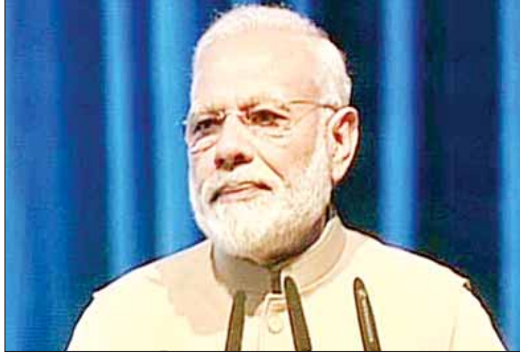
विध्वंसक विचारधारा को दर्शाती है। वहीं मोदी की बात है कि हमारे क्षेत्र में नफरत की इन विचारधाराओं को फैलाने वाले बातचीत के

प्रधानमंत्री ने कहा कि दुनिया में शांति कायम रखने के लिए सबसे बड़ी चुनौती दो देशों के बीच होने वाला विवाद नहीं, बल्कि एक खास विचारधारा है। उन्होंने कहा, नफरत और हिंसा के विचार में डूबे रहने वाले लोग ही शांति के लिए सबसे बड़ा खतरा हैं। हमारे श्रेत्र में आतंकवाद की समस्या इसी