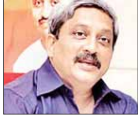
कमेटी के सचिव गिरीश चोइनकर ने पत्रकारों से कहा कि आगामी पणजी उपचुनाव में पर्रीकर को हार का आभास हो गया है इसलिए वह अपनी आधिकारिक स्थिति के

कांग्रेस ने शुक्रवार को मुख्यमंत्री मनोहर पर्रीकर पर आरोप लगाया कि वह आगामी पणजी विधानसभा उपचुनाव में सरकारी तंत्र का दुरुपयोग करने की कोशिश कर रहे हैं। पर्रीकर ने अपने आधिकारिक कक्ष में इस सीट से अपनी उम्मीदवारी की घोषणा की थी। वह इससे पहले भी 1994 से 2014 तक इस सीट का प्रतिनिधित्व कर चुके हैं। अखिल भारतीय कांग्रेस