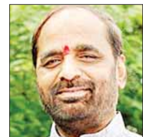
पाकिस्तान द्वारा बार-बार सीजफायर उल्लंघन को खत्म करने के लिए निष्कर्ष पर पहुंचेंगे। अहीर ने कहा, हम कमजोर नहीं हैं, हम धैर्य के साथ काम कर रहे हैं। हम किसी नागरिक को चोट नहीं पहुंचाना चाहते। हमारी आर्मी अच्छा काम कर रही है। पाकिस्तान द्वारा सीजफायर उल्लंघन पर जल्द ही सरकार ठोस कदम उठाएगी। शुक्रवार