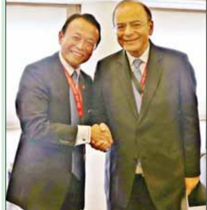
जापान दौरे पर गये भारत के वित्तमंत्री अरुण जेटली ने जापान के वित्तमंत्री तारो आसो से रविवार को मुलाकात की।