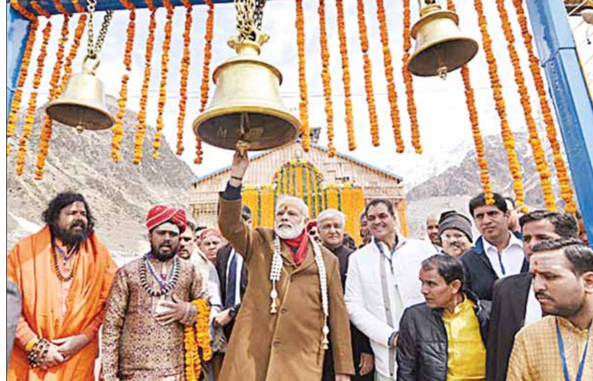
दर्शन बुधवार को उत्तराखंड के दौरे पर पहुंचे प्रधानमंत्री नरेंद्र मोदी ने केदारनाथ जाकर प्रथम दर्शन किए। इस अवसर पर उनके साथ उपस्थित मुख्यमंत्री त्रिवेन्द्र रावत, राज्यपाल के.के. पॉल, मंदिर के महंत, मंत्रीगण व नागरिक।

हाईकोर्ट में केस की रिव्यू याचिका खारिज होने के बाद दोषी ने सुप्रीम कोर्ट का दरवाजा खटखटाया था। बुधवार को सुप्रीम कोर्ट ने भी दोषी की याचिका खारिज करते हुए उसकी फांसी की सजा बरकरार रखी है।